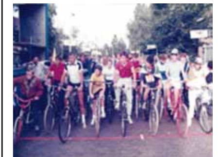
Wie staan er op deze foto? Hij is gemaakt tijdens de dikkebandenrace in 1985.

Wie kan ons helpen aan en heeft informatie over onderstaande foto's? Uw reactie kunt u sturen naar historischewerkgroep@gmail.com onder vermelding van 'nieuwsbrief 2-2017'.