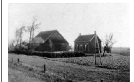
Welke boerderij is dit en waar stond deze?

Wist u dat: De HWS een beeldbank heeft? www.historischewerkgroepsaarndam.nl