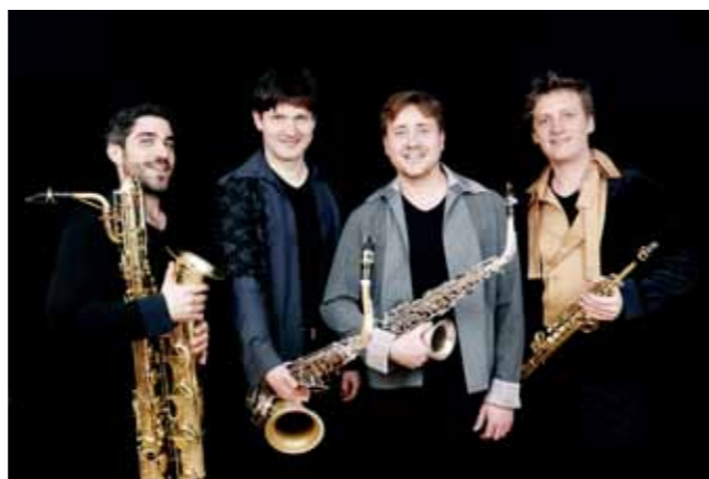
Amstel Saxofoon Quartet